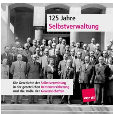
125 Jahre Selbstverwaltung