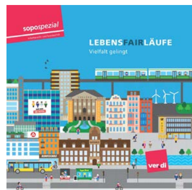
Lebensfairläufe – Vielfalt gewinnt