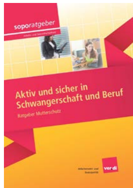
Soporatgeber Aktiv und sicher in Schwangerschaft und Beruf