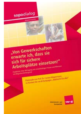
Sopodialog Pilotstudie im Kontext der ver.di-Kampagne „Wahlrecht für alle“