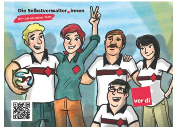
[Motiv „Mannschaft“; 24x18 cm]