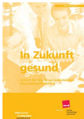
In Zukunft gesund