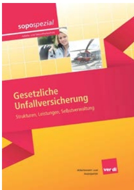
Sopospezial Gesetzliche Unfallversicherung