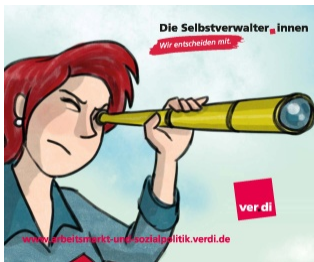
[Motiv „Viola“; 17x14 cm]