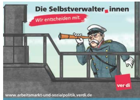
[Motiv „Bismarck“; 21x15 cm]