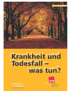
Krankheit und Todesfall – was tun?