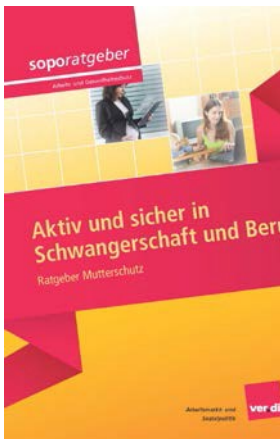
soporatgeber Aktiv und sicher in Schwangerschaft und Beruf