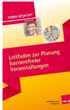
soporatgeber Leitfaden zur Planung barrierefreier Veranstaltungen