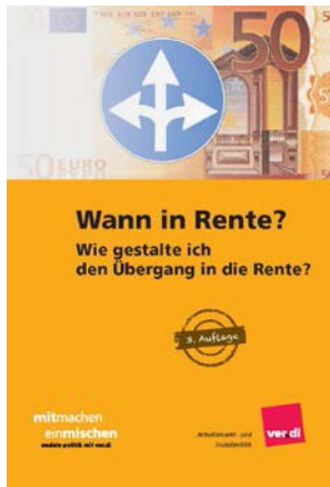
3. vollständig überarbeitete und aktualisierte Auflage, Juni 2018 Rechtsstand: 1. Juli 2018