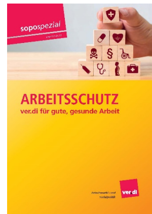
sopospezial Arbeitsschutz – ver.di für gute, gesunde Arbeit