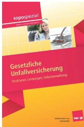
sopospezial Gesetzliche Unfallversicherung Strukturen, Leistungen, Selbstverwaltung