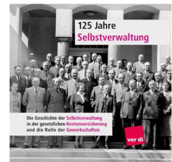
125 Jahre Selbstverwaltung