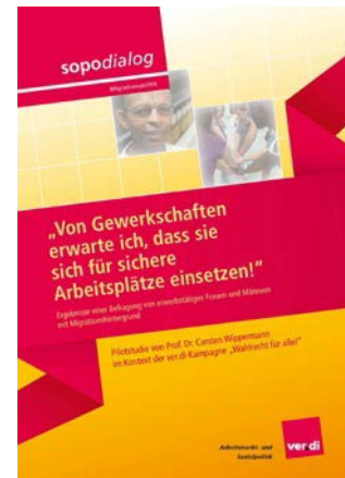
sopodialog Pilotstudie im Kontext der ver.di-Kampagne „Wahlrecht für alle“