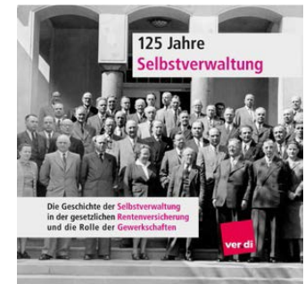
125 Jahre Selbstverwaltung