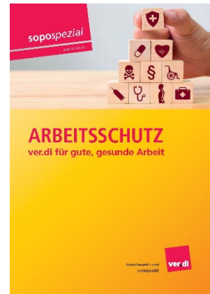
sopospezial Arbeitsschutz – ver.di für gute, gesunde Arbeit