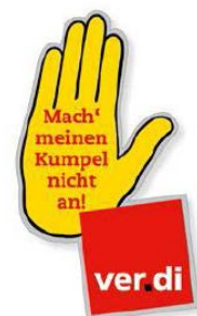
Ansteckpin Gelbe Hand/ver.di „Mach' meinen Kumpel nicht an“